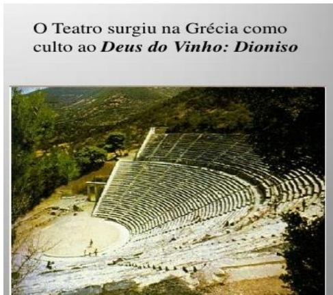
O Teatro surgiu na Grécia como culto ao Deus do Vinho: Dioniso

Dionísio era o deus da fertilidade, do vinho e da alegria e em sua homenagem dançavam sobre um tablado baixo ou arena chamada theatron que significa “local onde se vai para ver”. O hino que narrava a história de Dionísio, que ensinava o cultivo da uva e outros frutos chamava-se “ Ditirambo ”.