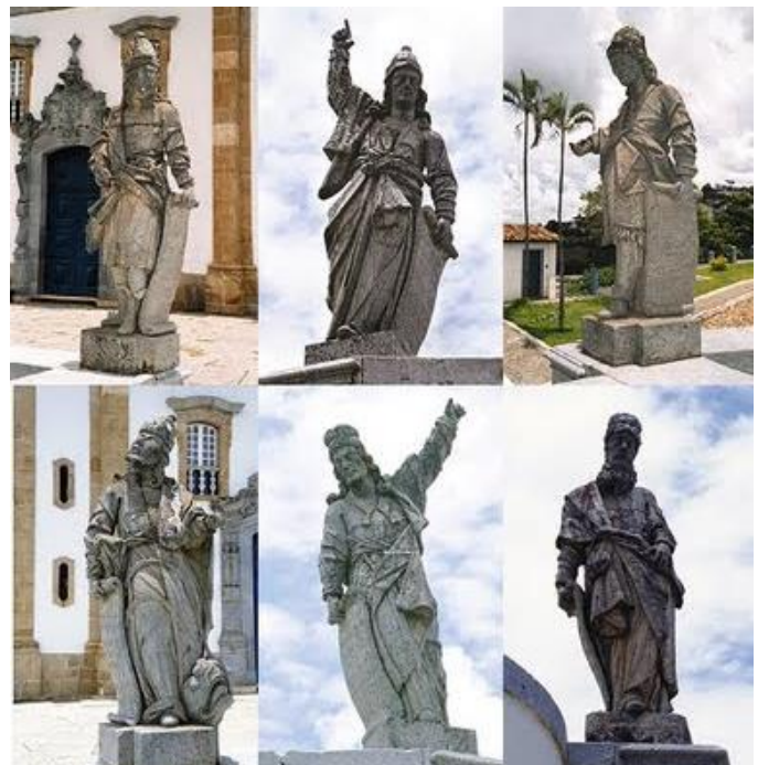
Igreja de São Francisco de Assis. (Minas Gerais)

→ “Os Doze Profetas” é um conjunto de esculturas em pedra-sabão feitas entre 1794 a 1804 por Aleijadinho; estão localizadas no adro do Santuário do Bom Jesus de Matosinhos, no município de Congonhas – em Minas Gerais. (Abaixo estão 6)