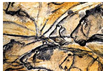
Caverna de Chauvet, Vallon-Pont d Arc, França

Elemento químico presente em mais de 10 milhões de compostos desde o precioso diamante ao mais comum como o grafite.