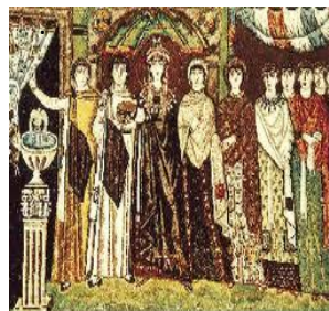
Verticalidade nas imagens

O mosaico consiste na colocação lado a lado de pequenos pedaços de pedra sobre gesso ou argamassa. Essas pedras coloridas são colocadas sobre o desenho previamente traçado. A seguir o artista aplica uma solução de cal, areia e óleo que preenche os espaços vazios aderindo melhor os pedaços de pedra.