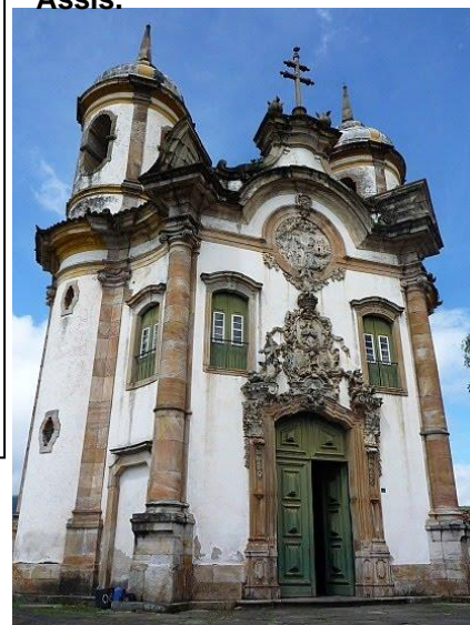
Igreja de São Francisco de Assis.

→ “Os Doze Profetas” é um conjunto de esculturas em pedra-sabão feitas entre 1794 a 1804 por Aleijadinho; estão localizadas no adro do Santuário do Bom Jesus de Matosinhos, no município de Congonhas – em Minas Gerais. (Acima estão 6)