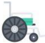
LA SILLA DE RUEDAS