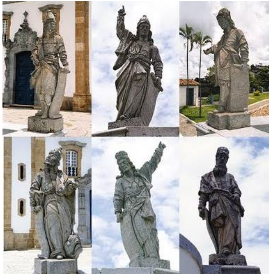
“Os Doze Profetas”

→ “Os Doze Profetas” é um conjunto de esculturas em pedra-sabão feitas entre 1794 a 1804 por Aleijadinho; estão localizadas no adro do Santuário do Bom Jesus de Matosinhos, no município de Congonhas – em Minas Gerais.