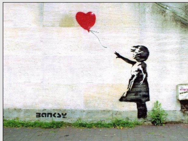
STENCIL DO ARTISTA BANKSY