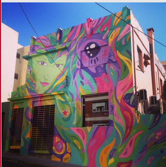
Arte de Brasileiro em Santa Maria na rua Serafim Valandro